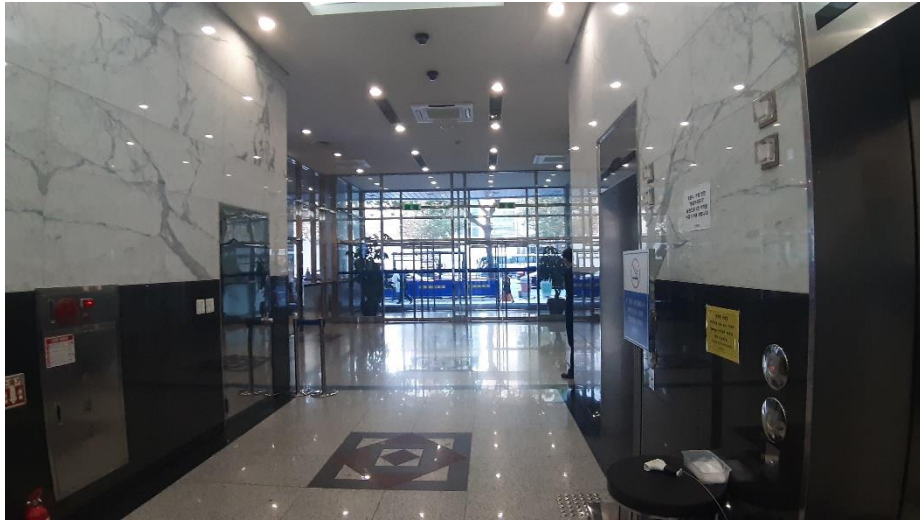
< 1층 로비 >