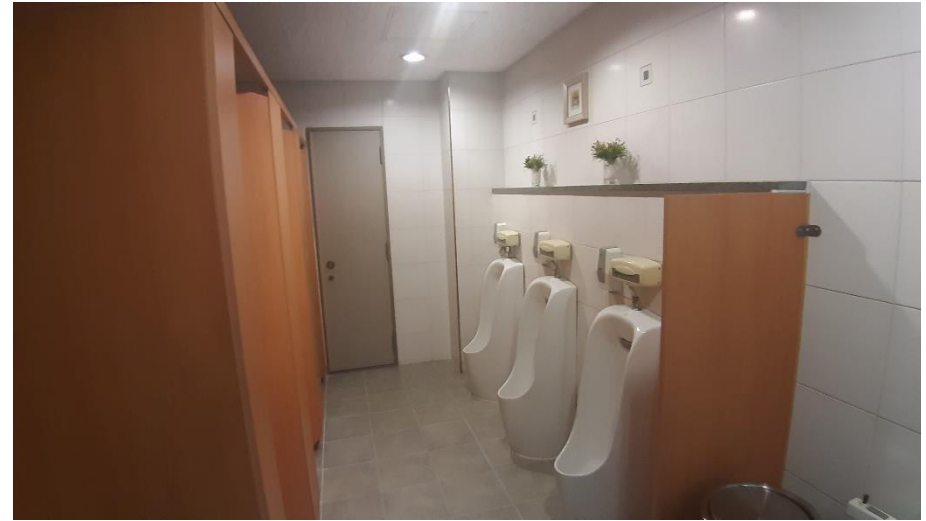
< 화장실 >