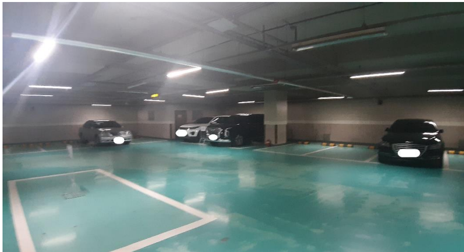
< 자주식 주차장 >